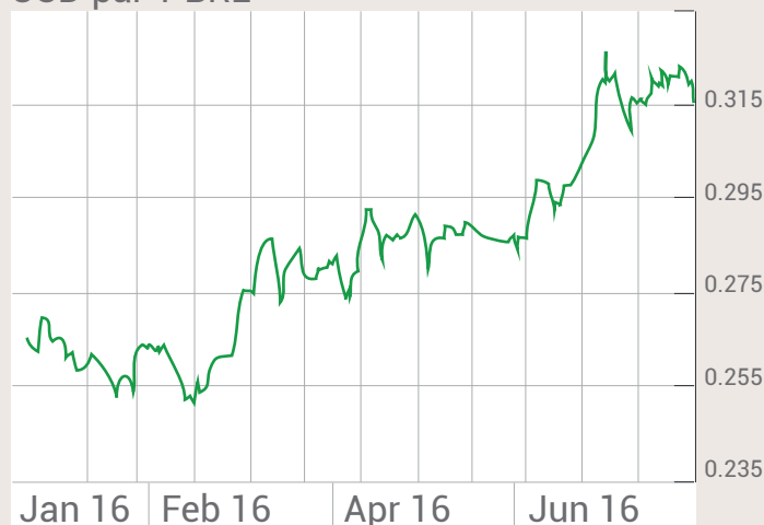
USD par 1 BRL

Dit betekent dat de vennootschap op papier reeds een flinke valuta winst heeft gemaakt op de wisseltransacties van de eerste obligatiehouders. Volgens informatie van valutaspecialist Ebury zal de koersstijging van de Braziliaanse real de komende jaren doorzetten onder meer ten gevolge van het monetaire "easing" beleid van de Europese Unie, die geld in de economie blijft pompen tegen zeer lage rentes.